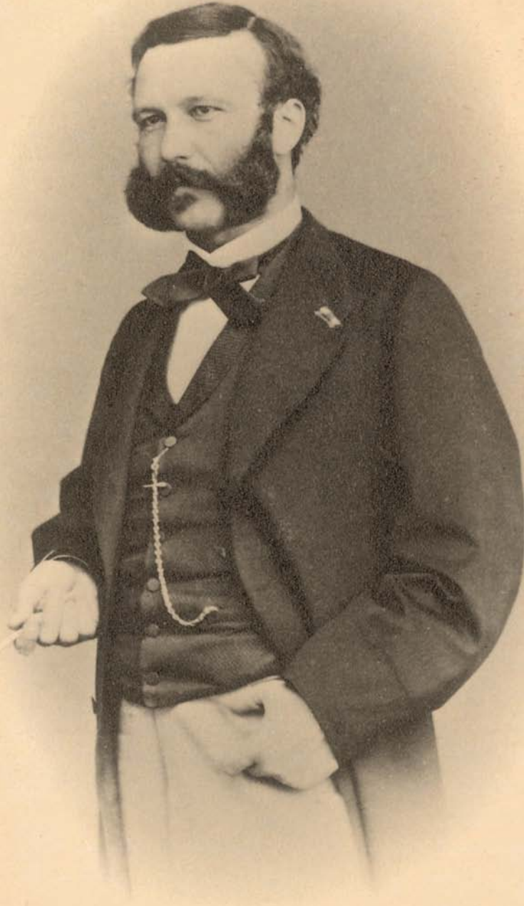
Жан-Ари Дюнан (1863 г.)